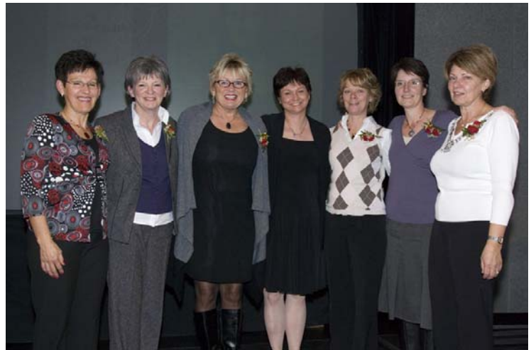
Voici quelques photos prises lors de cette soirée.